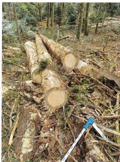
Figure 1 Épicéas attaqués par le bostryche Les arbres perdent leur écorce et l'insecte importe un champignon qui fait bleuir le bois

Entre mai et juin, plusieurs interventions de coupes avec écorçage des bois ont été réalisées pour tenter de circonscrire les premiers foyers de bostryches sur l'épicéa (scolyte typographe). La vague de chaleur subie fin août, a boosté la deuxième génération d'insectes, les arbres exténués n'avaient plus la capacité de se défendre. Malgré les efforts de lutte, entre septembre 2023 et mars 2024 env. 400 m 3 de chablis ont dû être récoltés.